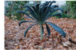
Garten-Acker-Pflanzen im Herbst. Acker & Co. 10.10.2010

Der hilft unseren Pflanzen beim Wachsen.